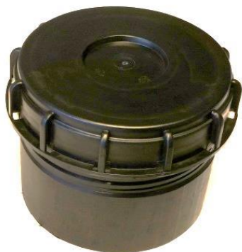
Vandtæt skruelåg og karm

Det vandtætte skruelåg fås i 3 typer og beskytter fjernvarmeventilen mod ovenfra kommende regnvand, fugt, salt og snavs, herunder bremsestøv, hvilket betyder nemmere betjening og længere levetid.